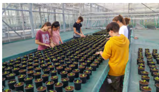
Des TP sur les exploitations du lycée