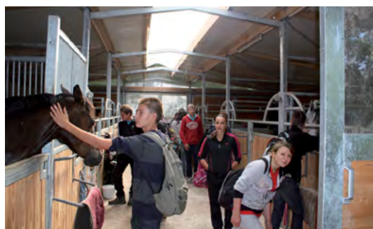
Des visites d'exploitations et d'entreprises

En seconde générale et technologique (pour les bons élèves).