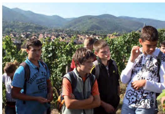
Des sorties sur le terrain