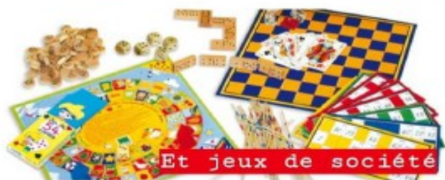
Et jeux de société